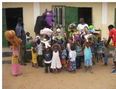
Børnehave får legetøj